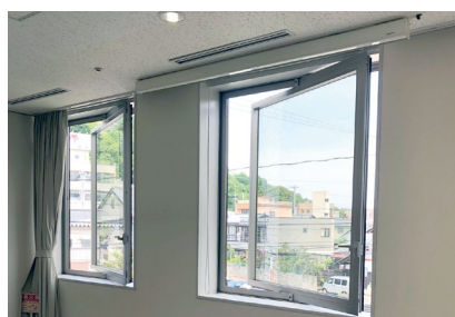
窓を開けて換気可能