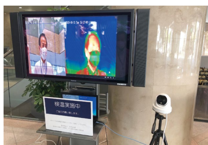
体温検知で集団感染を防止