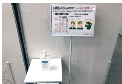
館内に消毒液常備