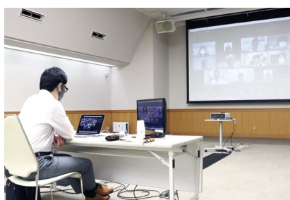
光回線でウェブ会議もスムーズ