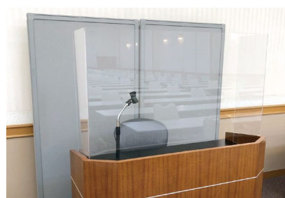
飛沫防止に役立つパネル