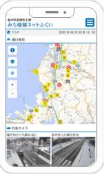
スマートフォン対応しました！

<提供情報> 除雪状況、道路カメラ、通行規制、積雪情報、排雪場所、道路情報板、冠水情報、関係機関リンク