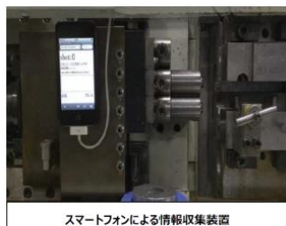
スマートフォンによる情報収集装置

自動車用の熱交換パイプから航空宇宙分野までを手掛ける部品製造業。社員の出勤から生産・在庫まで総合的に分析できる独自システムを構築。工場には iPod Touch等のスマートデバイスを設置することで「経営と現場の見える化」を図るなど積極的に経営にIT、IoTを活用している。