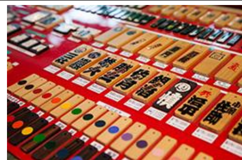
オーダーメイドの木札を提供