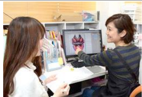
当社で働く社員たち