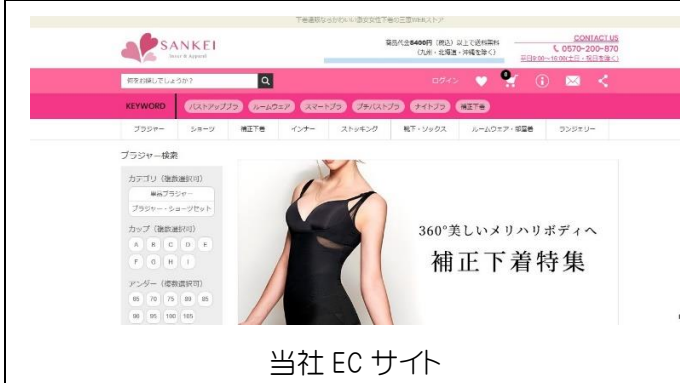
当社 EC サイト

女性用アンダーウェア・化粧品等を取扱う小売店。オンラインから実店舗へ誘導するO2O(Online to Offline)を目指して、社員のITスキル向上に始まり、社内のタスク管理(Redmine)、チャットツール(Slack)など、積極的にITを導入し事業を展開している。加えて、新卒・外国人の採用など社内人材の強化にも取り組んでいる。当社では目標達成に向けた計画的なIT運用や従業員を巻き込んだダイナミックな組織改革を学べます。