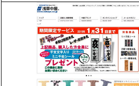
当社 EC サイト

明治43年創業、祭用品(腹掛、股引、足袋等)販売の老舗小売店。実店舗、インターネット、カタログなど複数の販売チャンネルを持つ。競争激化により会社経営が一度は停滞したが、基幹システムと顧客情報・在庫等を連携、データベースやウェブ等のサーバーの切り離しなど、ITを活用した合理化を図り経営を立て直した。業務・組織改革も進めることで、業務の円滑化、社員のITスキルの向上も進めている。当社ではITを活用した会社全体の合理化について学べます。