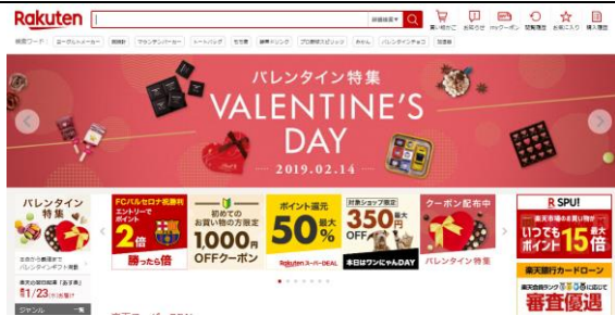
楽天のホームページ

インターネットサービスを展開するIT企業。ECモールの運営が有名だが、現在ではオンライン株式販売、クレジットカードなどの金融分野にも事業を展開している。多彩な事業展開とビッグデータの構築により、顧客に合ったサービスを提供している。電子決済分野では「楽天 Pay」を活用したサービス、商店街・地域振興にも力を入れている。