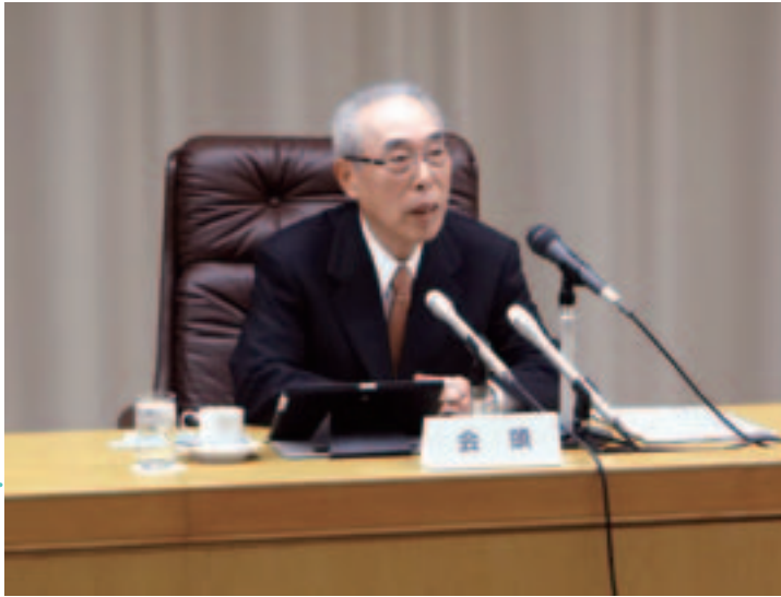
担当：総務・経理課

昨年を振り返り「4月の消費税増税の影響で駆け込み需要の反動が表れたが、10月末の日銀の第二次サプライズ金融緩和によって円安が急速に進み、年末には15年ぶりに日経平