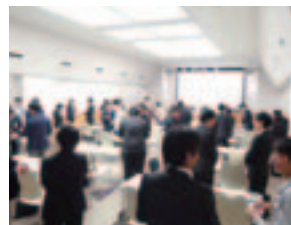
担当：経営支援・人材育成課

また、セミナー内では、自己分析として営業の行動パターンも体系的に紹介され、営業活動にはお客様に気付きを与え、不安や課題の解決を提案・提供し、「一緒にいいものを作って行こう」という姿勢が大切ということが強調された。