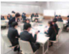
担当：経営支援・人材育成課

印象の良い発声方法・立ち居振る舞いなどの実 践演習を通じ、最初は緊張していた受講者も、終 盤には積極的に演習に取り組むことができた。