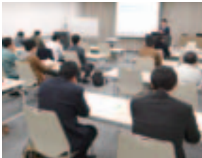
担当：経営支援・人材育成課

セミナー内では、受講者同士が自分の計画案を 紹介し合う時間を設け、自社の事業内容や今後の 計画を、相手に分かりやすくストーリー形式で伝 える手法についても学んだ。