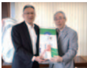
担当：会員サービス課