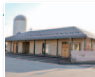
一見美容室には見えないお洒落な外観。店舗前の看板が目印。