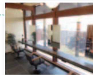
ガラス越しの庭には水の流れる壁が設置され、趣のある雰囲気を演出している。