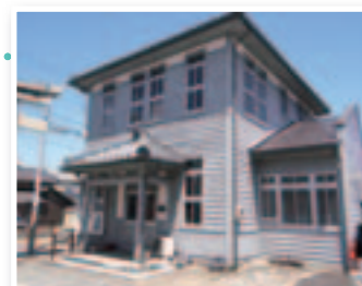
ギャラリーを兼ねたオフィス。経済産業省平成19年度近代産業遺産群認定の建物