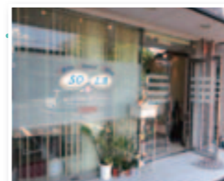
マンション1階の入り口に大きく書かれている店名が目印。