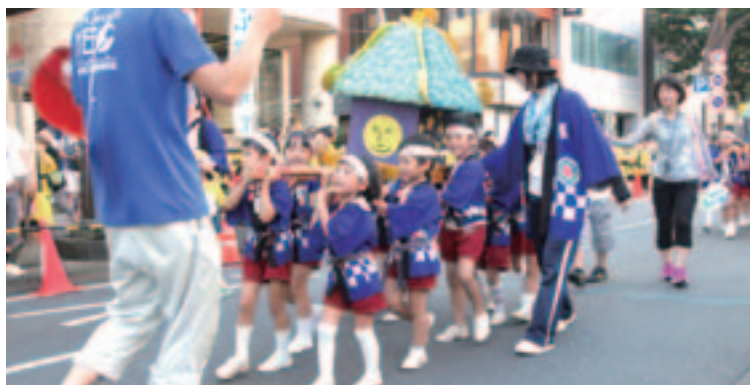
子どもパレードの様子

昨年、子どもや保護者も参加、参画できるまつりを目指し、民踊・YOSAKOIイッチョライの一部として初めて実施して好評だった、市内の子どもたちが手作りみこしを担ぐ子どもみこしを、『子どもパレード』と名を改めて実施しました。昨年を上回る12基のみこしと約200名の園児に参加してもらい、まつりの観客の方などに、子どもたちの元気な姿を届けることが出来ました。また、参加した園児の保護者の方からは、「良い思い出づくりになった」とのご感想を頂きました。そ