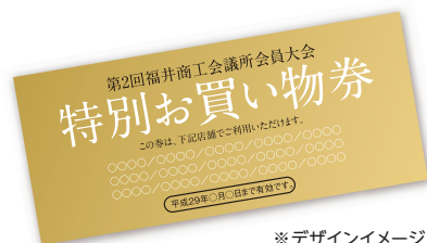
※デザインイメージ

来場者に出店者の店舗で利用できる、1,000円分の『お買い物券』を抽選で300名様に進呈!