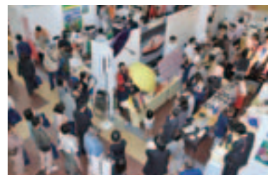
※第1回会員大会の様子