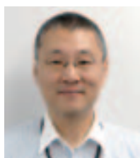
事業承継・再生支援部 (福井県事業引継ぎ支援センター)