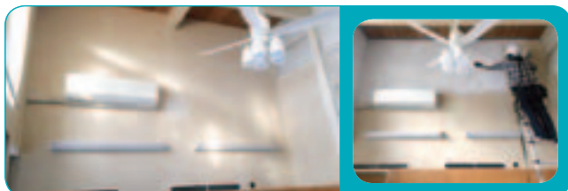
カビ・ヤニで汚れた壁も清潔感を取り戻せます

アパート、マンションの入居者が入れ替わるたび、壁紙の張り替え費用が高くお困りではありませんか？当店で壁紙を張り替えるのではなく、現状の壁紙をそのまま利用し塗装による原状回復を行います。また、カラー塗料を使用しオフィスのイメージチェンジなどにも対応しています。コスト削減をお考えのオーナー様、物件の管理者様、お気軽にお問合せください。