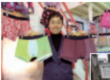
プレゼントにも最適なメイドイン福井のパンツ