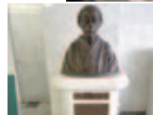
史跡をたどりながら福井の歴史を学びます