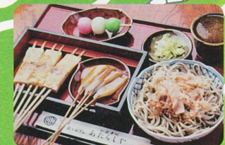
花見メニュー/ でんがくおろしそばセット(だんご付) 1,050円

住 足羽山上町111 ☎ 0776-36-3733 営 平日 9:00~21:00(Lo20:00) 週末 9:00~22:00(Lo21:00) 休 無休