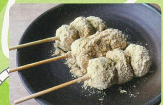
花見メニュー/よもぎきなこだんご 400円

住 足羽山上町147-1 ☎ 0776-35-1919 営 10:00~21:00 休 不定休