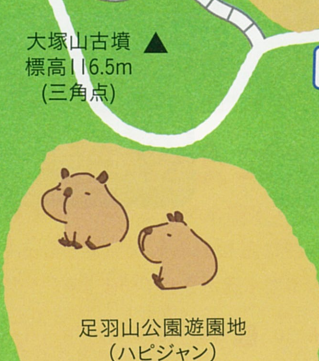
足羽山公園遊園地 (ハビジャン)