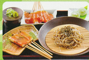
花見メニュー/ 足羽山づくりセット 1,400円