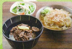
花見メニュー/若狹牛そばセット 1,300円