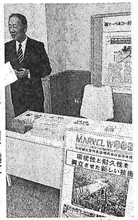
耐久性倍増の保存処理木材をアピール

市中央3丁目2-15）は、北陸初の遠赤外線式融雪装置「解けルモ」をPR。特殊セラミックコーティングのハロゲンランプから大量に遠赤外線を照射し、階段やスロープ、出入り口など用途に合わせてピンポイントで融雪を