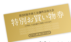
※デザインイメージ

出店者の店舗で利用できる、1,000円分の 『お買い物券』を抽選で300名様に進呈!