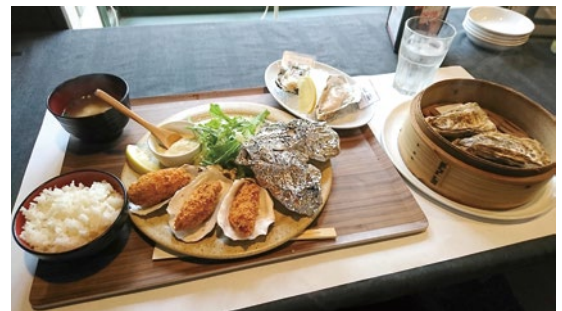
オーシャンズの「牡蠣かき定食」。約2,500円でこの量！

金をかけずに、素早く伝えることができます。実際に同店へ食事に行きました。右の写真の通り、なんと9個分の牡蠣が一度に味わえる牡蠣づくしのランチを注文。昼食にこれだけのものを楽しめる、実に素晴らしいひと時となりました。