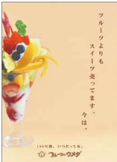
⑪ フルーツのウメダ / 4年 酒井 遥香