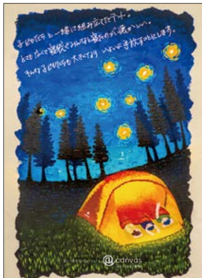
⑧ canvas / 4年 中山比奈子