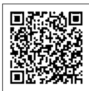
売上債権保全制度 福井商工会議所 HP