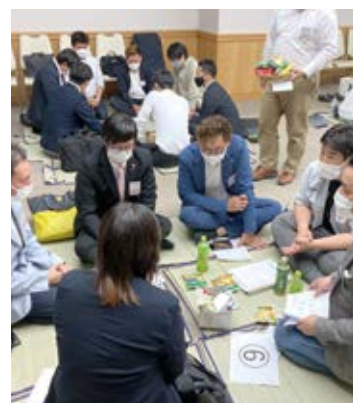
交流タイムの様子

コロナ禍は未だ終息している訳ではありませんが、福井YEGとしては「密をさける」「マスクを外しての会話を避ける」など出来る限りの感染対策を講じながら、組織の活性化や地域の活性化に繋がる様々な事業や例会を今後も引き続き実施していきます。