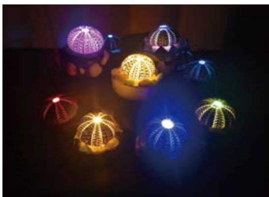
1年間の試行錯誤を経て完成したウニランブ

お誘いいただいたことがきっかけです。弊社では、ふくのねが立ち上がった二年ほど前に、体験事業を始めていました。ふくのねは初回から参加しており、タコ漁やワカメの種