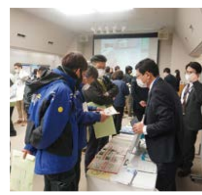
フェアでは、ブースに分かれた出展者(ITベンダー)からツールの機能等について、デモを見ながら理解を深めることができます。(写真は昨年度開催した「スマート工場ミニ展示会」の様子)

今回は、福井県内に拠点を構えるITベンダー(IT導入補助金の対象ツールを取り扱っている企業)7社が出展します。身近なITベンダーからツールに関する情報をまとめて収集・検討できる機会です。