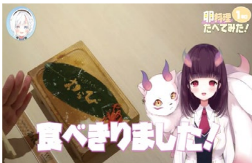
同社が運営するヴァーチャルユーザーグループ「学窓ハクメイ」に所属するVtuberも県内飲食店とコラボし、集客に貢献しています。

採用や人材定着でも成果を出せるデジタルコンテンツ リクルート用にオリジナルキャラクターを作ってほしいと依頼する中小企業の方も見られるようになりました。中には、採用募集ポスターに自社のユニフォームを着たキャラクターを起用したところ、リクルートイベントでブースに来訪する学生が増え、応募数も昨年の倍近く増えたという方もいらっしゃいました。