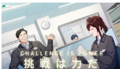
Memorynator (株) (坂井市) が制作した松浦機械製作所の公式キャラクターとリクルートページ。若者向けプロモーションとして活用されています。(株)glowも同社の協力先として県内企業のキャラクターデザインを手掛けています。

福井には魅力ある中小企業がたくさんありますが、会社説明会やインターンシップに参加しなければ、その社風や仕事内容を体感できないというハードルがあります。少しでも自社に興味を持ってもらえるきっかけ