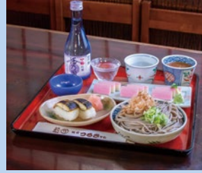
越前つるきそば本店