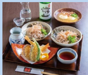
めん房つるつる江戸店