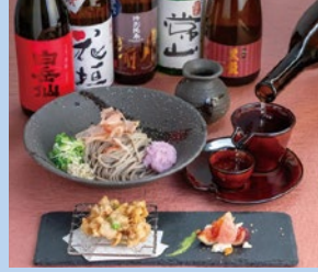
越前蕎麦 dining 櫻庭