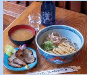
つるきそば佐佳枝支店