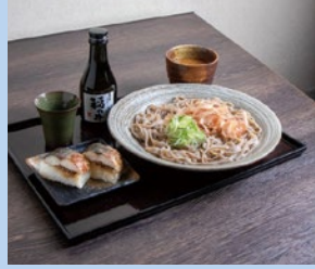
あみだそば福の井