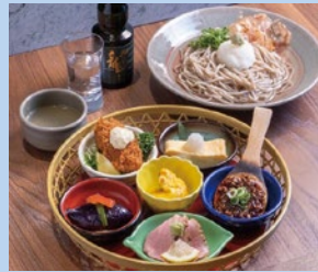
蕎麦 dining 一福