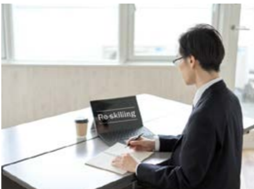
DX推進リーダーの育成や、従業員のリスクリングにぜひご活用ください。

福井商工会議所では、企業のDX推進を応援すべく、オンライン学習プラットフォーム「Udemy business (ユーデミー)」と連携しています。「ユーデミー」は、いつでも、どこでも、利用者のペー