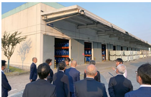
日華化学(中国)有限公司を視察