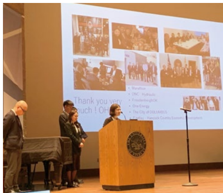
地元の社会人向けに行ったプレゼンテーション

研修参加者が所属する自社の事業内容を英語で紹介。高校生、大学生、社会人と、対象を替え3回にわたり実施しました。