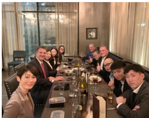
地元経済人たちとの交流会

アメリカのビジネスにおいて特に重要視されているネットワークの形成。英語でのコミュニケーションの練習も兼ねて、様々な交流会に参加し、ネットワークを広げました。