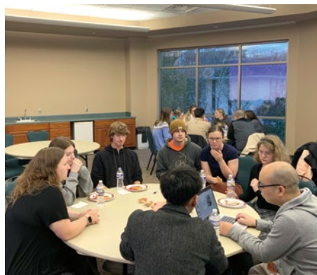
地元大学生との交流会