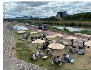
中)焚き火x音楽ライブイベント 下)河川敷バーベキューイベント