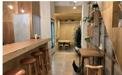
上)コーヒーと日本酒が楽しめるお店

まちなかの持続可能なにぎわいを創生していくため、「県都まちなか再生ファンド事業」により、まちの魅力向上に寄与する店舗等の改修等を支援しています。これまで21件(令和5年11月現在)が認定され、コーヒーと日本酒が楽しめるお店など各所で整備が進んでいます。また、浜町では、今年度創設した「観光誘客に資する洗練された店舗等整備支援事業」を活用し、越前がにを前面に打ち出した店舗の開業も予定されています。