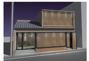
右)越前がにを前面に打ち出した店舗イメージ