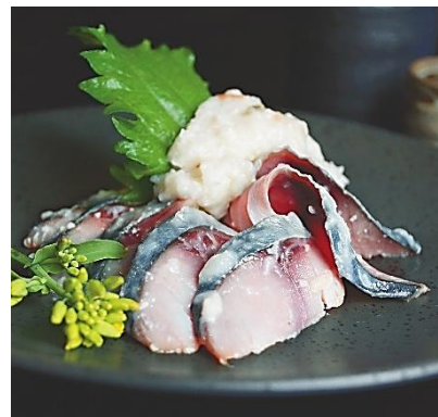
鯖なれずし スライス