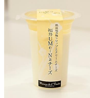
福井 UME-Na チーズ