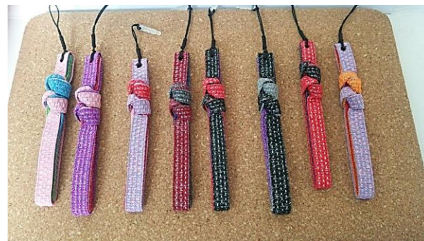
越前織ストラップ