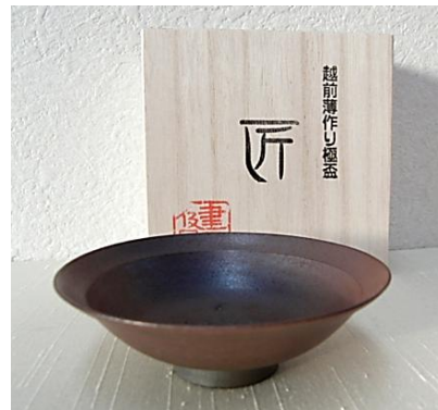
越前薄作り極盃 匠