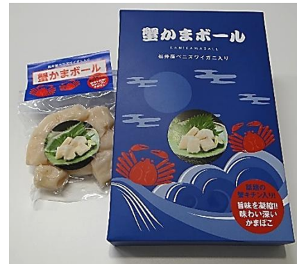
蟹かまボール 5 袋入