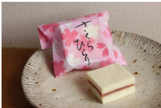
お菓子とうふ(さくらひらり)