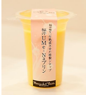
福井 UME-Na プリン