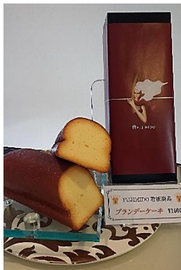
ブランデーケーキ