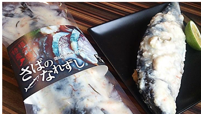
鯖なれずし 丸一尾