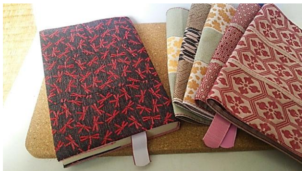
越前織製ブックカバー